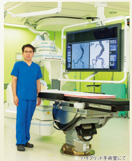
ハイブリッド手術室にて

*1 手術などに伴う痛みや出血などをできるだけ少なくする治療 *2 治療用の細い管のこと