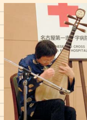
※写真は昨年の様子です。