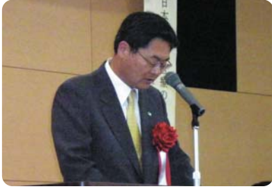
来賓の挨拶をする西村眞愛知副知事

総合周産期母子医療センター開設10周年記念行事を平成20年7月5日に内ヶ島講堂で