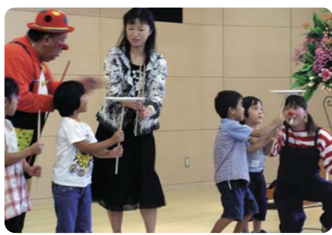
パフォーマンスショーに参加して楽しむ親子